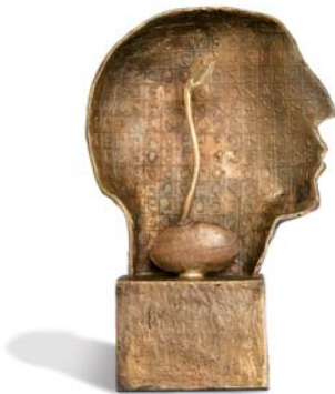
Preisträger Contracting-Award 2006 für innovative Energielösungen

GETEC hat sich seit der Gründung im Jahr 1993 zu einem der Marktführer der Contracting-Branche entwickelt und ist neben dem Stammhaus in Magdeburg mit Niederlassungen an den Standorten Hannover, Berlin, Dortmund, Frankfurt und München vertreten.