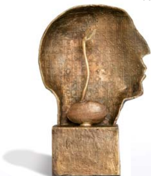
Preisträger Contracting-Award 2006 für innovative Energielösungen

GETEC AG ist Spezialist für Contracting und federführend bei der Umsetzung der Contracting-Idee für die Energiewirtschaft. Insbesondere bei der Energieversorgung von Liegenschaften und Immobilien besitzt GETEC spezielles, innovatives und umfassendes know-how. GETEC hat sich seit der Gründung im Jahr 1993 zu einem der Marktführer der Contracting-Branche entwickelt und ist neben dem Stammhaus in Magdeburg mit Niederlassungen an den Standorten Hannover, Berlin, Dortmund, Frankfurt und München vertreten.